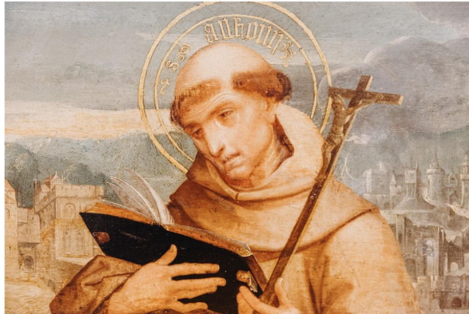
Santo António | Museu Nacional Grão Vasco – Viseu

Nascido em Lisboa, Santo António foi na verdade batizado com o nome Fernando de Bulhões. Escolheu o nome António quando ingressou na Ordem Franciscana. Padroeiro de pescadores, grávidas, marinheiros, viajantes, agricultores, idosos, entre outros, é o nosso Santo casamenteiro, dedicado a pregar as escrituras, que tão bem conhecia. E é a 13 de junho que se celebra o Dia de Santo António.