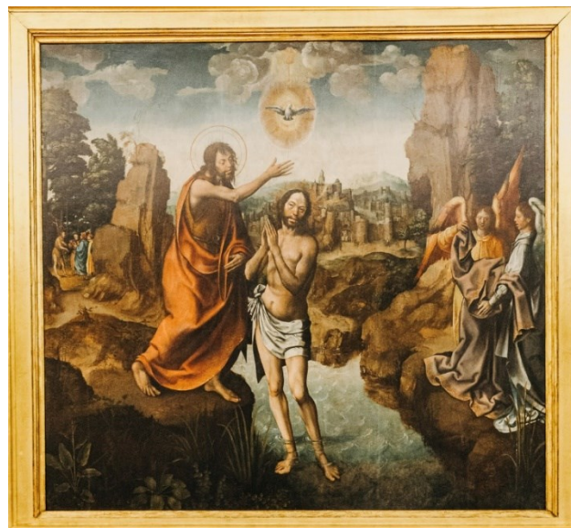
São João | Museu Nacional Grão Vasco – Viseu

“Em dia de São João, lança-se um balão e comem-se sardinhas no pão”. Assim manda a tradição!